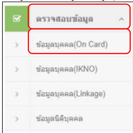
ภาพที่ .1 เมนูการเข้าหน้าจอ ข้อมูลบุคคล(On Card)

1. เมื่อเข้าสู่ระบบ GDx แล้ว คลิกที่เมนู ตรวจสอบข้อมูล > ข้อมูลบุคคล(On Card)