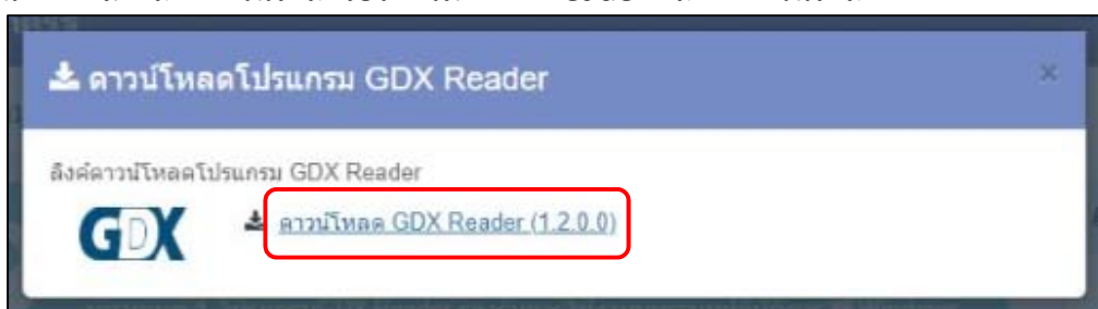
ภาพที่ .3 หน้าต่างแสดงลิงค์ดาวโหลดโปรแกรม GDx Reader

3. เมื่อหน้าต่างแสดงลิงค์ดาวโหลดโปรแกรม GDx Reader คลิกที่ ดาวโหลด