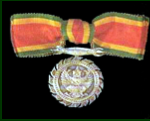
เหรียญจักรพรรดิมาลา (ร.จ.พ.) (สตรี)