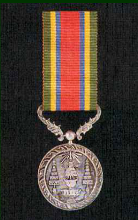
เหรียญจักรพรรดิมาลา (ร.จ.พ.) (บุรุษ)