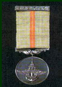
เหรียญช่วยราชการภายในเอเชีย (ช.ร.) การรบสงครามมหาเอเชียบูรพา

Medal for Service Rendered in the Interior ( Ladies )