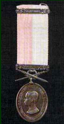
เหรียญดุษฎีมาลา เข็มศิลปวิทยา (ร.ด.ม.(ศ.)) (สำหรับพระราชทาน พลเรือน)

The Dushdi Mala Medal (Military & Police)