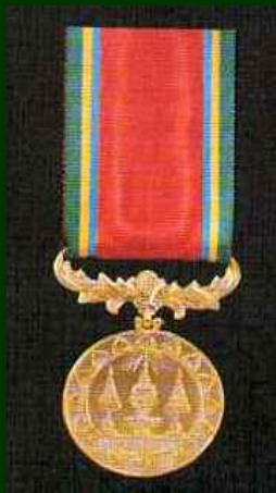
เหรียญบุษปมาลา