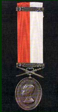
เหรียญดุษฎีมาลา เข็มศิลปวิทยา (ร.ด.ม.(ศ.)) (สำหรับพระราชทาน ทหาร, ตำรวจ)