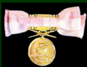
เหรียญดุษฎีมาลา เข็มศิลปวิทยา (ร.ด.ม.(ศ.)) (สตรี)