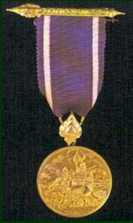
เหรียญราชการชายแดน (ช.ค.)