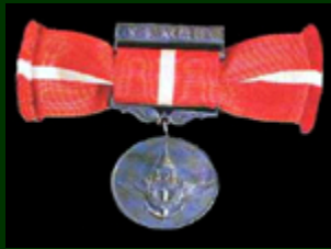
เหรียญช่วยราชการ เขตภายใน (ช.ร.) การรบสงครามอินโดจีน (สตรี)

Medal for Service Rendered in the Interior