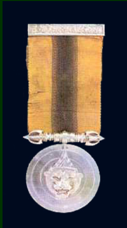
เหรียญสารทูลมาลา