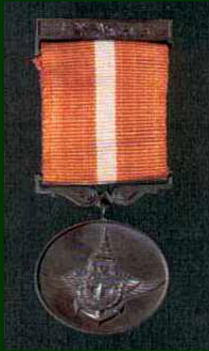
เหรียญช่วยราชการ เขตภายใน (ช.ร.) การรบสงครามอินโดจีน